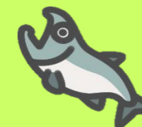
サーモンといくらの親子丼