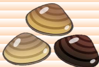
シーフードのペペロンチーノ